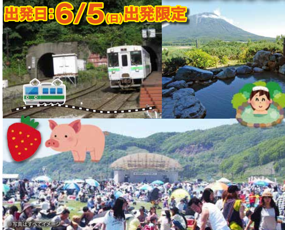
※写真はすべてイメージ