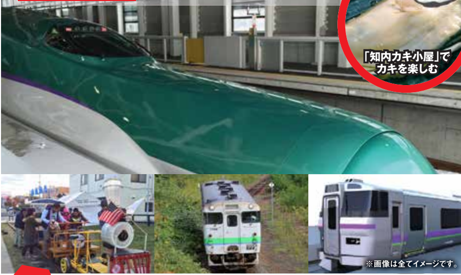
「知内かき小屋」でカキを楽しむ