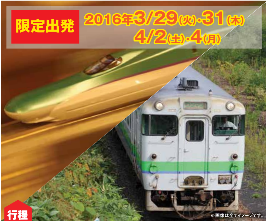
※画像は全てイメージです。