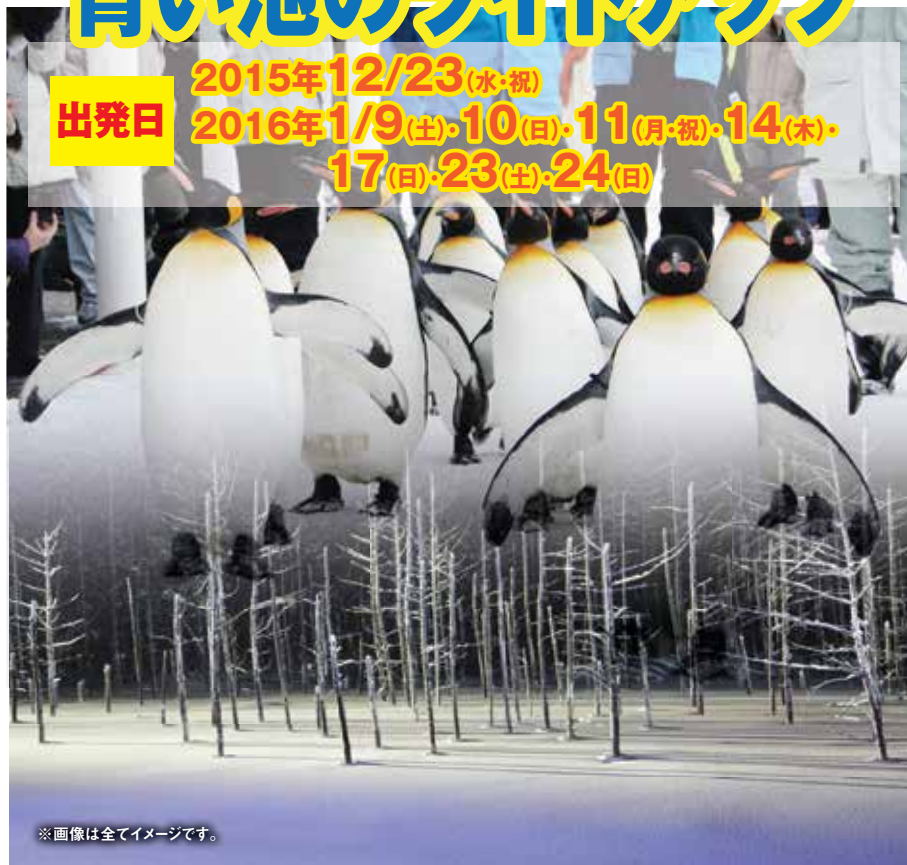
※画像は全てイメージです。