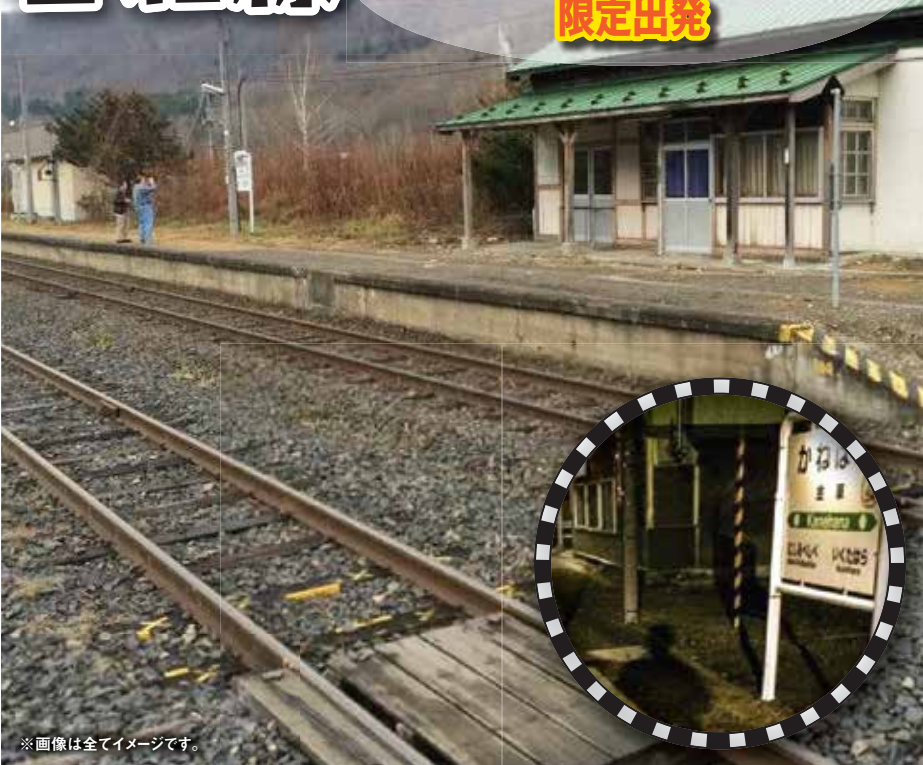
※画像は全てイメージです。