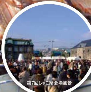
第7回しゃこ祭会場風景