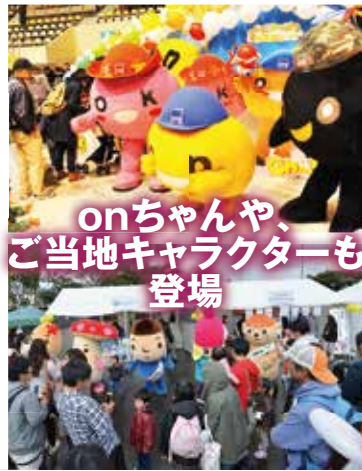
onちゃんや、 ご当地キャラクターも 登場