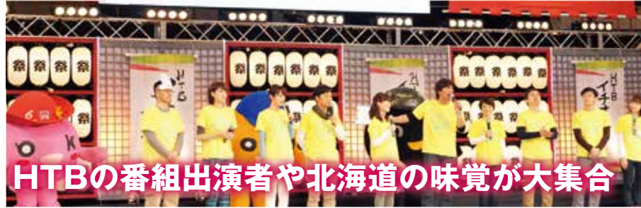
HTBの番組出演者や北海道の味覚が大集合