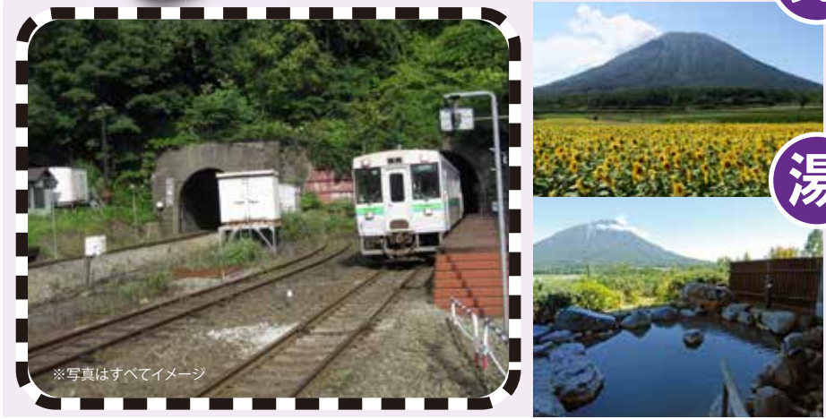
*写真はすべてイメージ