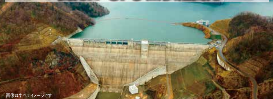
画像はすべてイメージです