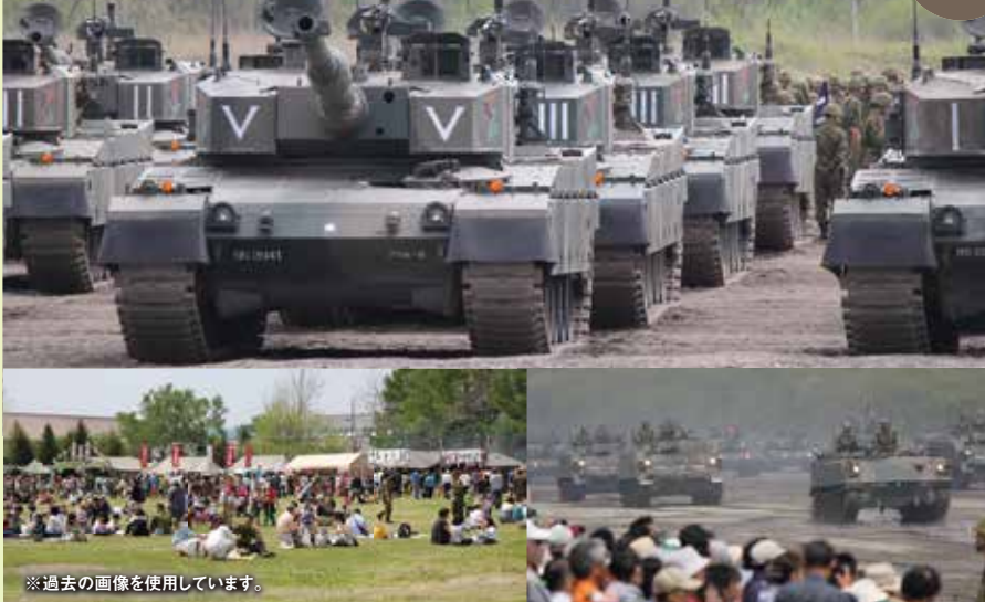
※過去の画像を使用しています。