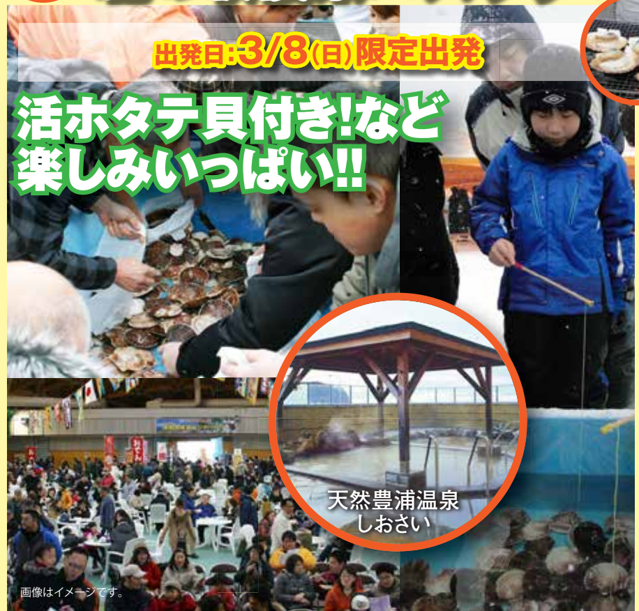
天然豊浦温泉 しおさい