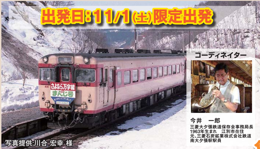
コーディネーター