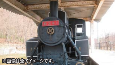
※画像は全てイメージです。