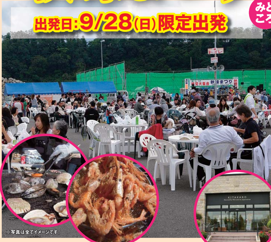
※写真は全てイメージです。