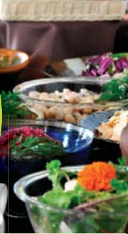
ファームレストラン ヴィーズ