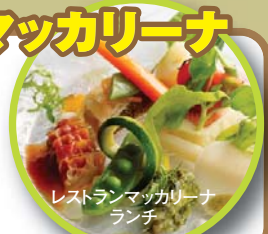
レストランマツカリーナランチ

道産野菜を使ったフランス料理が味わえるオーベルジュ。料理に使う野菜のほとんどが地元の真狩産で、シェフの自家畑で栽培しているものが登場することもあります。