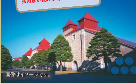
画像はイメージです。