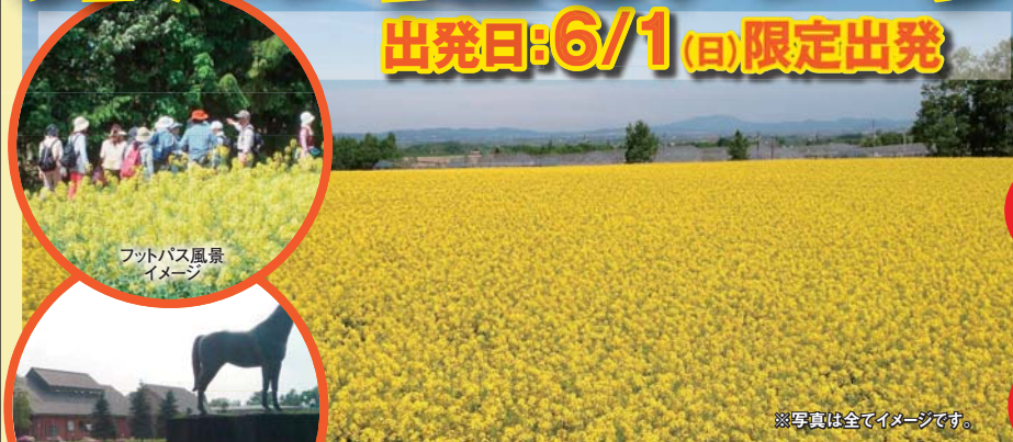
フットバス風景イメージ