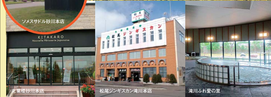
※写真は全てイメージです。