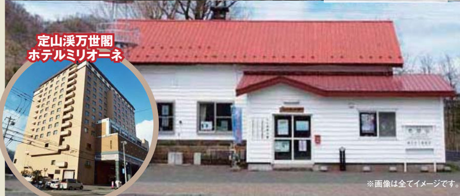
定山溪万世閣ホテルミリオーネ