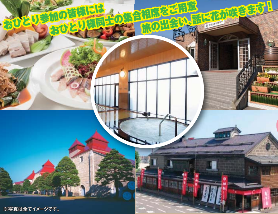
*写真は全てイメージです。

おひとり参加の皆様には おひとり様同士の集合相席をご用意 旅の出会い、話に花が咲きます!