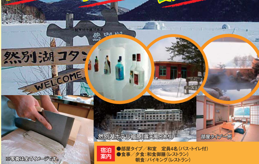
然別湖ホテル福原(露天風呂あり)