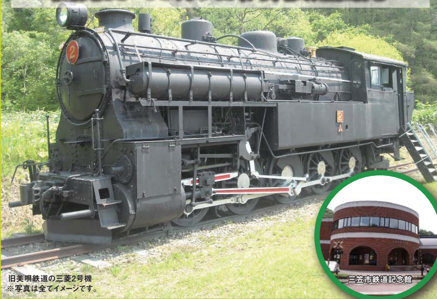
旧美唄鉄道の三菱2号機 ※写真は全てイメージです。