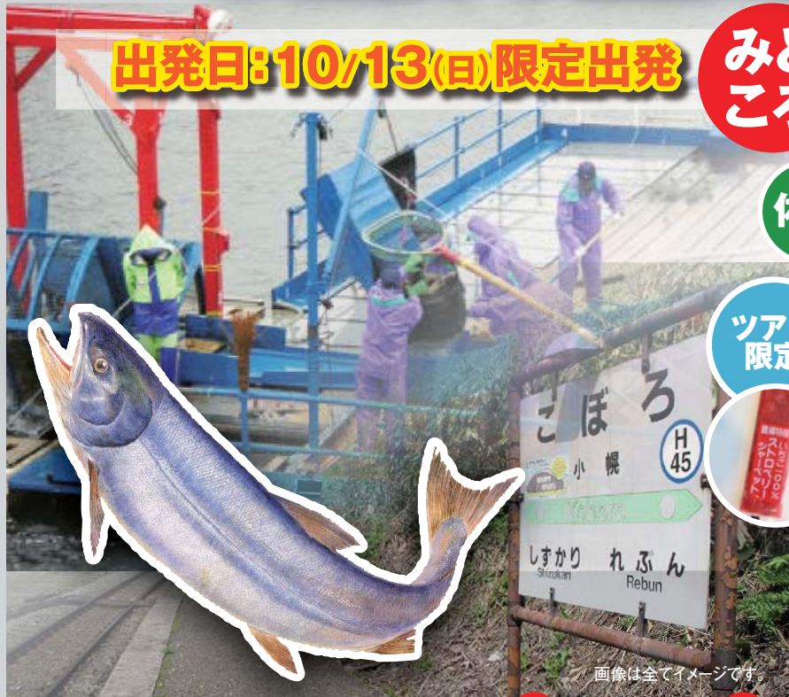
画像は全てイメージです