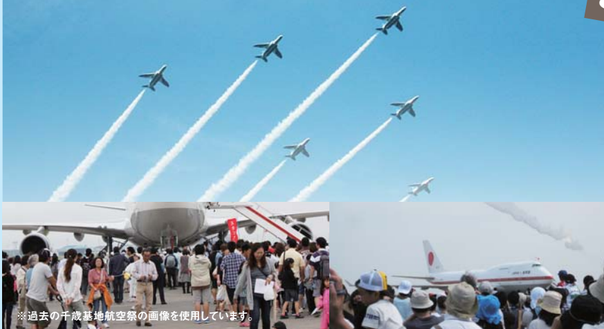
※過去の千歳基地航空祭の画像を使用しています。