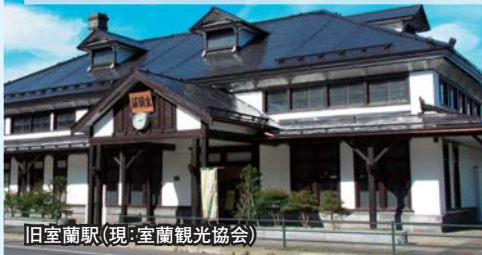
旧室蘭駅(現:室蘭観光協会)