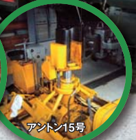
※写真は全てイメージです。 ジオラマ アントン15号 [増毛駅] 雄冬