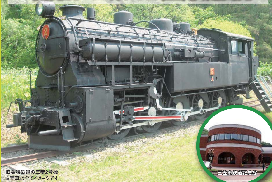
旧美唄鉄道の三菱2号機 ※写真は全てイメージです。