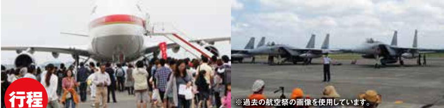
※過去の航空祭の画像を使用しています。