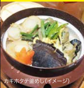
カキホタテ釜めし(イメージ)