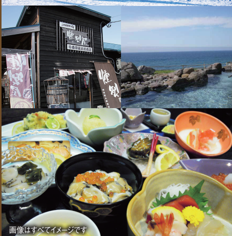
画像はすべてイメージです