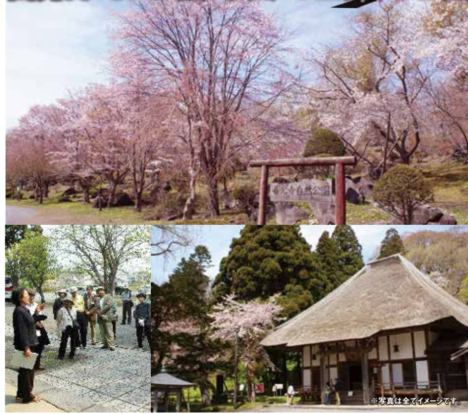
※写真は全てイメージです。