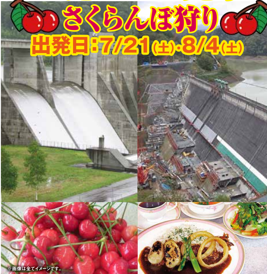
※画像は全てイメージです。