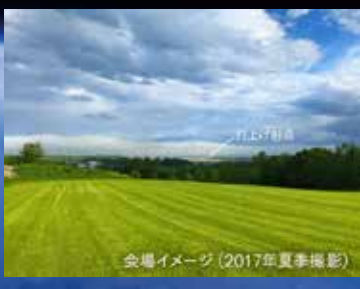
会場イメージ(2017年夏季撮影)