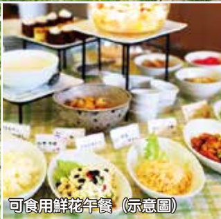
可食用鮮花午餐 (示意圖)