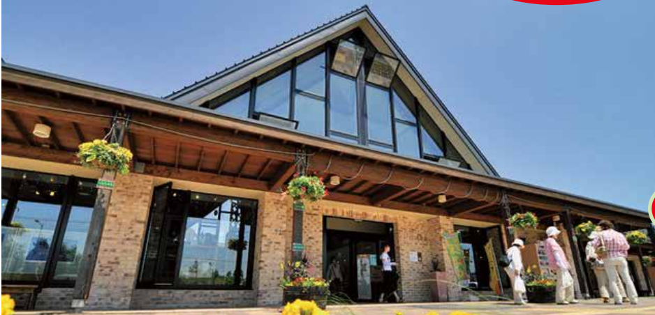
Sun Garden (示意圖)

小孩價格：3歲~國小生價格和大人相同(提供餐食, 座席) 未滿3歲免費但無餐食, 座席 行程結束後將拜託您填寫一份調查意見表