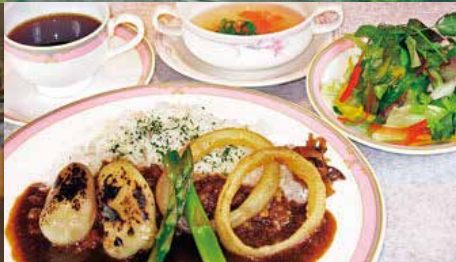
※画像は全てイメージです。