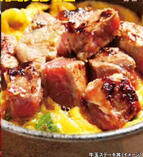
牛玉ステーキ丼(イメージ)