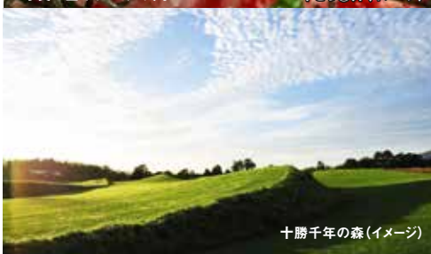
十勝千年の森(イメージ)