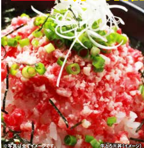
※写真は全てイメージです。