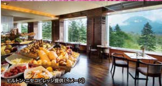
ヒルトン・ニセコビレッジ提供(イメージ)