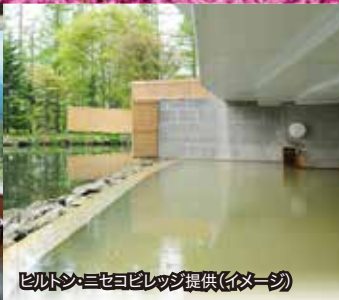
ヒルトン・ニセコビレッジ提供(イメージ)