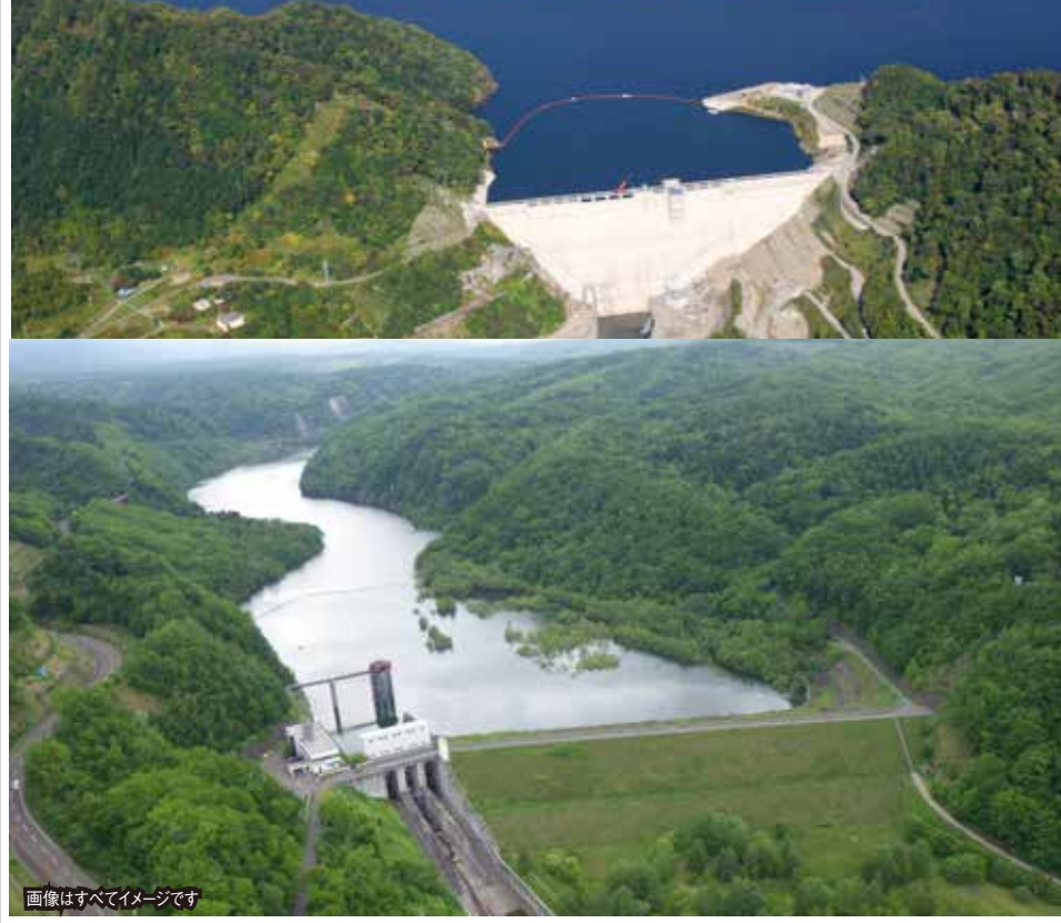
画像はすべてイメージです

● 夕張シューパーロダムでは、ダム周辺の道路等が工事中のため、見学内容が変更となる場合があります。● 衣服や靴が汚れる場合がございます。● 雨具および防寒具は各自にてご持参ください。● サンドルやスリッパ等脱げやすい履物はご遠慮いただき、動きやすい服装で参加をお願いいたします。● カメラや携帯電話には落下防止の為、ストラップ等の着用をお願いいたします。● 見学の際は、開発局職員の指示に従い、安全に注意してください。● 本人の不注意によるケガ、事故等については開発局では責任を負いかねます。(施設見学前の飲酒はお控えください) ● 北海道開発局からのアンケートにご協力をお願いする場合があります。● 報道関係者が取材のため同行する場合がございますのでご了承ください。● 洪水等への対応などの都合により、見学中止となる場合があります。● 夕張シューパーロダムの見学箇所は夕張川ダム総合管理事務所1階展示スペースと地下連絡通路を通りダム堤頂となります。● 施設内は、ヘルメットの着用をお願いします。(開発局で用意します) ● 漁川ダムの監査廊(点検用通路)見学では、長い階段がありますので、自力歩行が可能な方のみ見学となります。