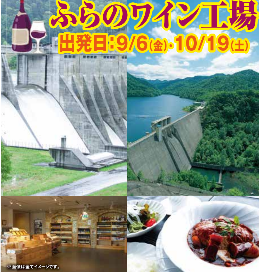
※画像は全てイメージです。