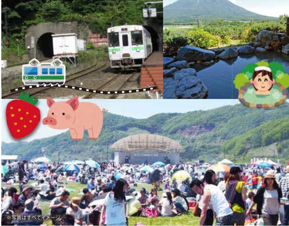
※写真はすべてイメージ