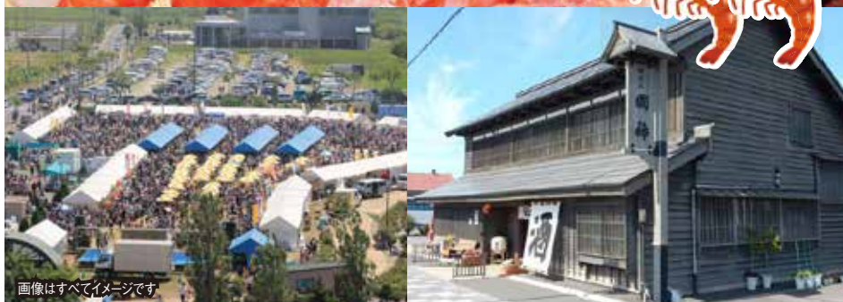
画像はすべてイメージです