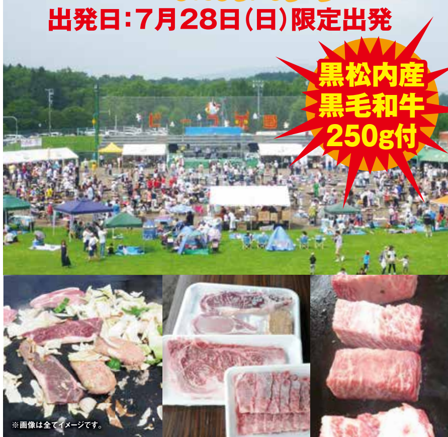
※画像は全てイメージです。