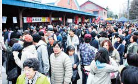
※画像は昨年度のお祭り模様です。