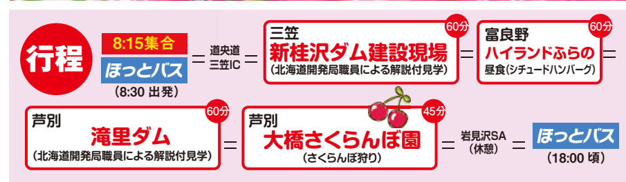
滝里ダム(芦別) 新桂沢ダム(三笠) ハ일랜드ふらの(昼食イターナ) ※画像は全てイメージです。