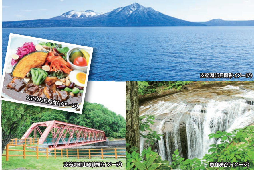
支笏湖(5月撮影イメージ)

出発日 毎週土曜日 7月11・18・25、8月1・8・15・22・29 9月5・12・19・26