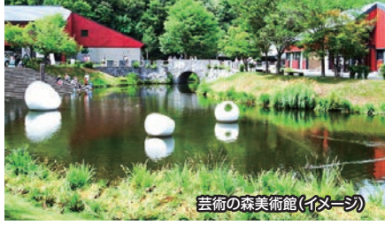
芸術の森美術館(イメージ)