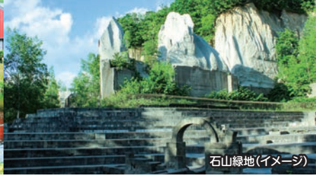
石山緑地(イメージ)