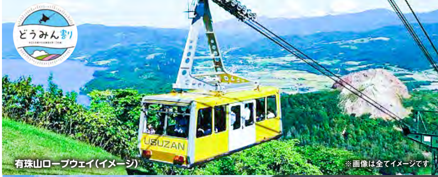
有珠山ロープウェイ(イメージ)

じゃが豚鍋御膳。じゃがいもを使った皮の中に豚挽肉をもちもちの中からジューシーなお味があふれます。刺身も付きます。