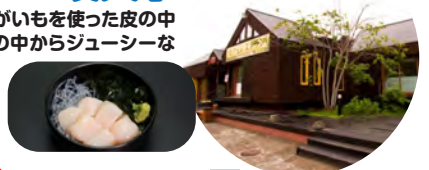
レストラン噴火亭の昼食(イメージ)