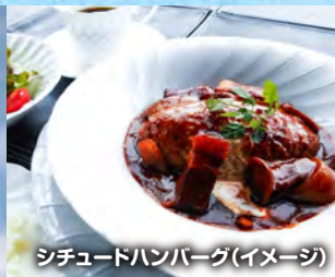
シチュードハンバーグ(イメージ)