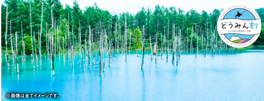
※画像は全てイメージです。