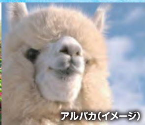
アルパカ(イメージ)