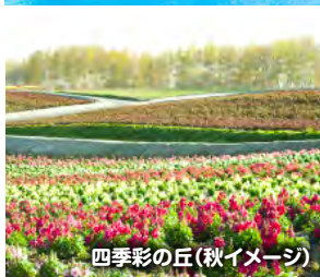
四季彩の丘(秋イメージ)