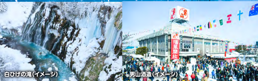
白ひげの滝(イメージ)