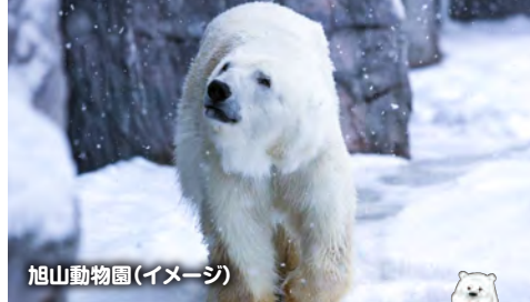
旭山動物園(イメージ)