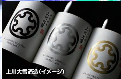
上川大雪酒造(イメージ)