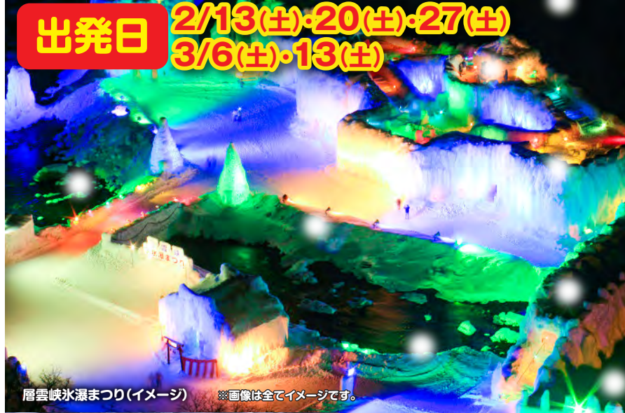
層雲峡氷瀑まつり(イメージ) ※画像は全てイメージです。