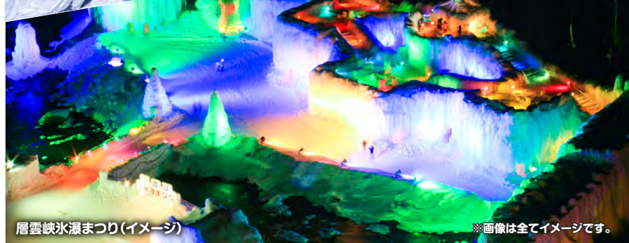
層雲峡氷瀑まつり(イメージ)