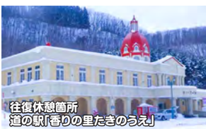
往復休憩箇所 道の駅「香りの里たきのうえ」

ガリンコ号Ⅲ・ガリンコ号Ⅱは、船首に装備されたドリル状のスクリュウを回転させ、流氷を砕きながら進みます。「ガリガリ!ゴリゴリ!」と音を立てて砕かれた大きな氷塊が、一度海に沈み再び海面に浮かんでくるその景色は圧巻の一言。2021年1月にデビューした新造船「ガリンコ号Ⅲ IMERU」は、総トン数370t、定員235名で、ガリンコ号Ⅱより一回り大きな砕氷船です。冷暖房完備の客室、自動販売機や売店も完備されてし快適に流氷クルージングが楽しめます。IMERU(イメル)はアイヌ語で「光」を意味し、全長45・55メートル、幅8・5メートル、総重量366トンで、旅客定員は235人。最大速度は時速約30キロで2代目より約10キロアップ。船首のらせん状のスクリュウは2基あり、流氷上で回転して氷を割って前進する。