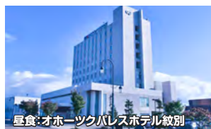
昼食:オホーツクパレスホテル紋別