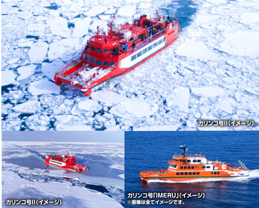
ガリンコ号Ⅱ(イメージ)

1/30(土)・31(日) 2/6(土)・7(日)・21(日)・23(火・祝)・28(日) 3/6(土)・7(日)・13(土)